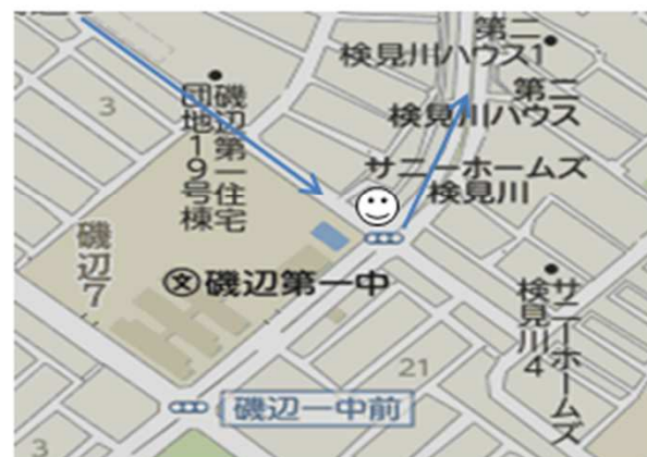
Aコース ⑤磯辺中学グランド横 (信号手前)