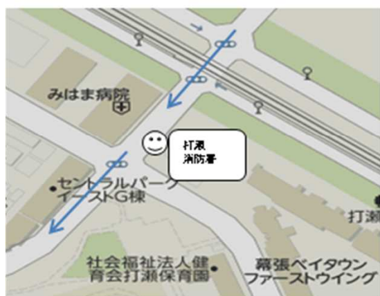
Aコース ②打瀬消防署横(信号手前)