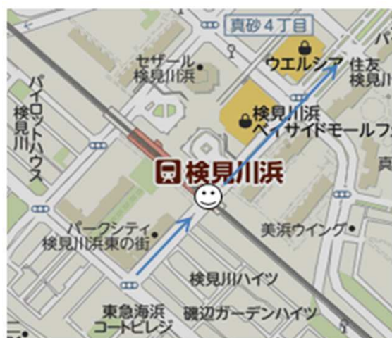
Aコース ⑥検見川浜駅 南口2ガード下 (イズミヤ側)