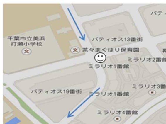
Aコース ③打瀬ミラリオ1番館 手前 交差点付近