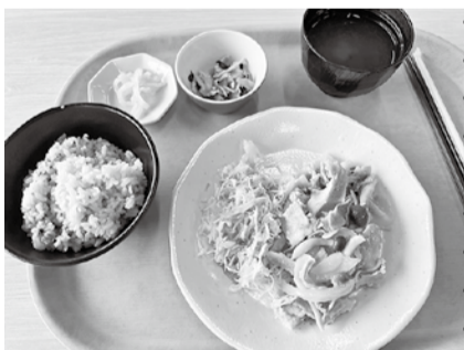
日替わりB ¥600 ご飯は「健康米」でした

中に入ると、とても明るく開放感があります。 おしゃれなオフィスつて 印象ですよ。