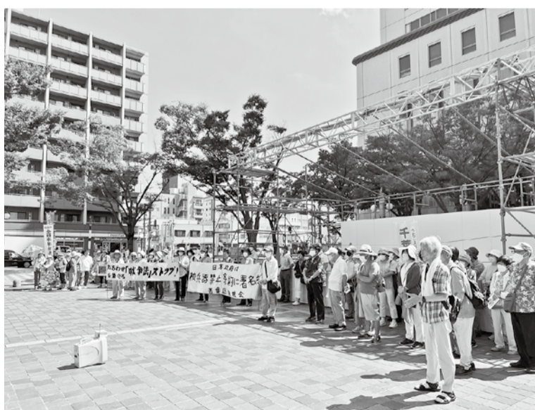
千葉市中央公園では100人以上が集まりました