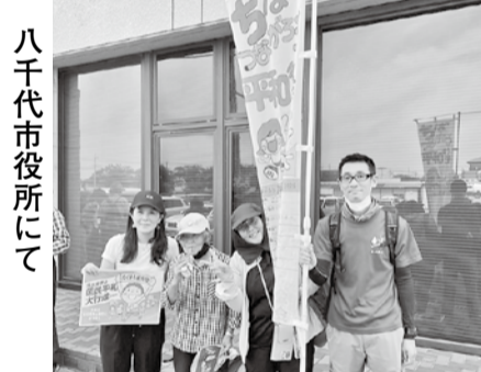
八千代市役所にて

行く先々で、たくさんの方との出会いがあり、元気をもらって歩きました。入所している老人ホームから参加の方、ガンの手術後だけ引継ぎ式は出たいと来られた方。初めてお会いしたのに、話は弾みました。