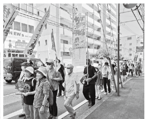
柏の行進は、猛暑の中1時間ほど「暑いけどがんばろうね」と励まし合って歩きました