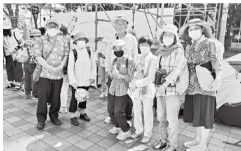
→千葉市中央公園にて