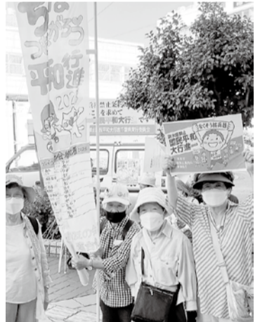
八千代台駅のスタンディングアピール行動